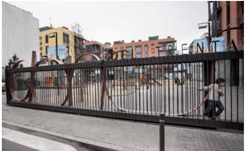
Una reixa tanca la plaça de les Dones del 36 durant la nit

la gent no s'assegui al mur i han tret la pèrgola que feia ombra. "Són petites decisions que t'expulsen dels espais", explica l'entrevistada. "Converteixen les places en espais poc confortables fins que deixen de ser un referent i un punt de trobada per al veïnat". Altres elements desagradables són les furgonetes que aparquen al mig del pas, el desordre del mobiliari urbà o els pàrquings que foraden les places. Per a Sanz: "Trias ha dut totes aquestes dinàmiques a l'exageració. Per dir que s'enfronta a la sobredensificació, l'ajuntament recorre a les prohibicions: no es pot beure fora de les terrasses ni tocar la guitarra. No reconeixen que el problema principal són els bars. Hi ha un excés de bars: és una invasió total". ◀