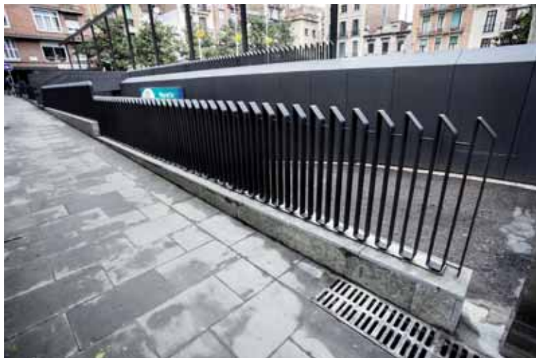
Bancs individuals. Jardineria amb un afegit que impedeix seure-hi. Barana per impedir que la gent segui, a la plaça del Sol / VÍCTOR SERRI