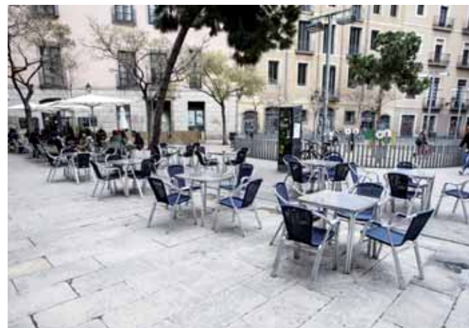
Les terrasses de bars són omnipresents a cada cop més zones de la ciutat. A dalt, plaça de la Revolució (Gràcia). A baix, plaça George Orwell (Ciutat Vella)

tua sobre l'espai per modificar actituds, conductes i formes de relació social que no encaixin amb el model de ciutat com a objecte de consum". Es tracta d'una política urbanística neoliberal que, tot i que ha arribat al seu clímax amb el mandat de Trias, es remunta deu o quinze anys enrere.